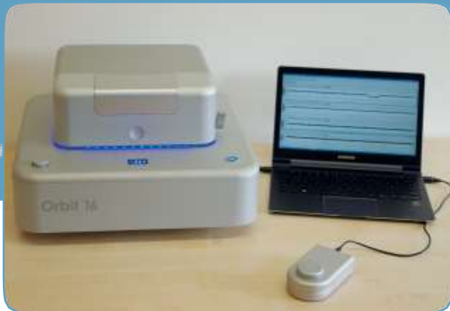
Orbit mini with big brother Orbit 16.